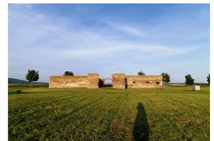
Abbildung 4: Der Kreuzstadel in Rechnitz.