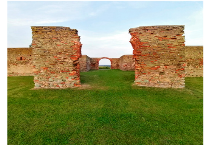
Abbildung 5: Der Kreuzstadl in Rechnitz.

Auch wenn über die Erschießungen selbst in Rechnitz – zumindest hinter vorgehaltener Hand – gesprochen wurde, kann K.H. keine konkreten Angaben zur Lokalisierung der Gräber machen: „Wo sie sie eingegraben haben, wissen wir ja nicht. Haben die ein Massengrab gemacht oder was, ich weiß es nicht.“