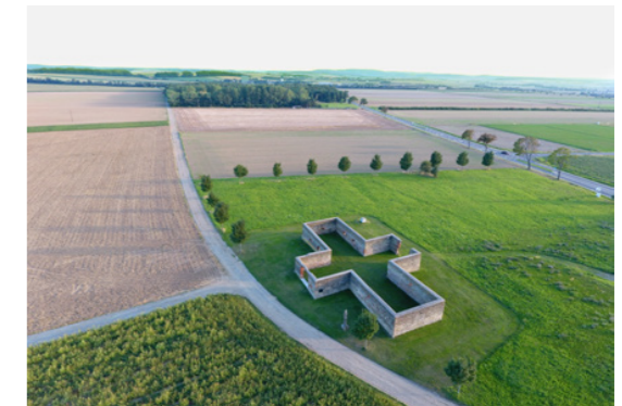
Abbildung 14: Der immer wieder als Verdachtsfläche geführte Kreuzstadt in Rechnitz.

chen Kontakt hatte sie allerdings keinen: „Das haben wir nicht dürfen. Wir haben nicht einmal selbst viel reden dürfen, nur arbeiten, da hat es nichts gegeben. Du hast nur schaufeln müssen.“ Sie betont zudem, dass ihnen das Helfen untersagt war: „Denen hast nicht einmal ein Stück Brot geben können, das war nicht erlaubt.“ Untergebracht seien die jüdischen Zwangsarbeiterinnen und -arbeiter einerseits im Schlosskeller und andererseits in Baracken gewesen: „Die haben selber die Bretter dort raufragen und bei den Baracken sind sie dann untergebracht gewesen. [...] Aber man hat dann nichts mehr gehört [...], wir haben nur gesehen, wie sie die vielen Menschen da heraufgetrieben haben nach Rechnitz.“ Bezüglich des Massakers gibt die Zeitzeugin an, dass auch sie zu dieser Zeit Rechnitz aufgrund der herannahenden Kämpfe verlassen und im Wald Unterschlupf gefunden habe. Sie merkt an, erst am nächsten Tag vom Massaker erfahren zu haben: „Ich hab’ das immer nur gehört, wenn ich am nächsten Tag rausgekommen bin arbeiten, dass es geheißen hat, heut Nacht haben sie Juden erschossen.“ Das Schweigen ihres Dorfes begründet sie mit der Angst, die geherrscht habe: „Ja, da war ja die Russenzeit gerade, da hat jeder Angst gehabt. Das war alles so eine Geschichte, ich weiß nicht, wie ich das sagen soll, aber da hat man alles in einen Mantel gehüllt, da ist nichts ausgeredet und weitergeredet worden.“ Ob das Massengrab jemals gefunden wird, weiß Johanna Linsbauer nicht; sie gibt zu bedenken,