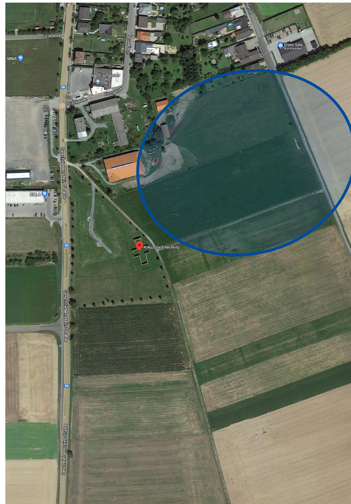
Abbildung 13: Luftaufnahme Rechnitz 2021, In diesem Bereich sollten sich laut zwei unabhängig voneinander interviewten Zeitzeuginnen die Gräber befinden.