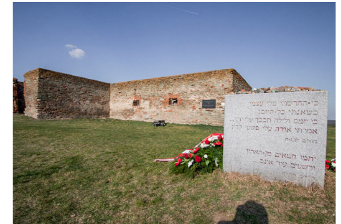
Abbildung 6: Heute ist der Kreuzstadl in Rechnitz zentraler Ort des Gedenkens an die Opfer des Massakers.

Während Gleichaltrige meist gar nichts vom Massaker wussten, arbeitete auch das restliche Dorf nicht an einer aktiven Erinnerungskultur mit. Sehr lange gab es keine Bestrebungen, die Gescheh-