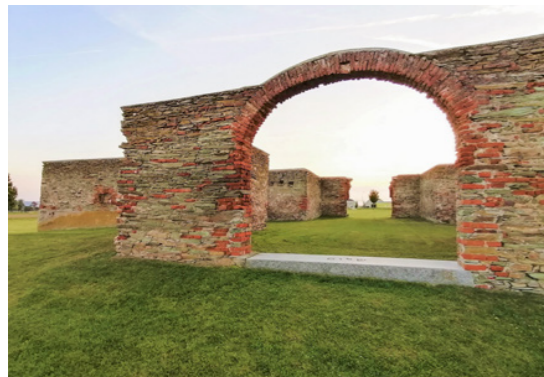
Abbildung 15: Der Gedenkort Kreuzstadl in Rechnitz.

Sie mutmaßt, dass das Massaker innerfamiliär thematisiert worden sei – aufgrund ihres jungen Alters blieb es ihr gegenüber jedoch unerwähnt: „Aber da haben die Eltern nicht viel darüber geredet, also wahrscheinlich schon untereinander, aber ich war ja noch ein Kind. Zu mir haben’s da nicht viel geredet darüber.“