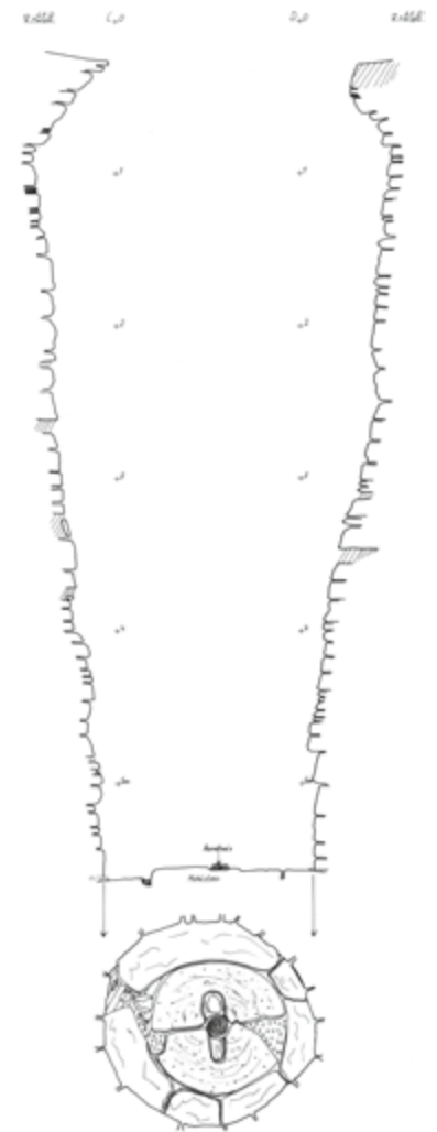
Schnitt durch den Zisternenschacht

Aus dem Vorklärbecken floss das Wasser in eine deutlich größere längliche Kammer, die ebenfalls unterirdisch angelegt war. Den Boden dieses kanalähnlichen Beckens bildet heute noch ein Belag aus Bachkieseln, die Absicherung nach oben erfolgte durch ein flaches Ziegelgewölbe. Im Scheitel des unterirdischen Kanals, der als Absetzbecken für Schwebstoffe im Wasser diente, befindet sich eine viereckige Zustiegsöffnung für Revisionen, deren Seiten aus einer Einfassung aus Muschelkalk bestehen. Ein an der Innenwand des Kanals in erhöhter Lage angebrachter kleiner Durchlass leitete schließlich das bereits vorgereinigte Wasser in den Sandfilter, welcher dem tiefen Wassersammelschacht (Zisterne) vorgeschaltet war. Nachdem das Wasser langsam die Filterzone, die aus feinem Flusssand bestand, durchflossen hatte, sickerte es sukzessive und sauber in den Schacht der Hauptzisterne. Ein solches ausgeklügeltes System zur Wasseraufbereitung wird als Filterzisterne bezeichnet. ➔